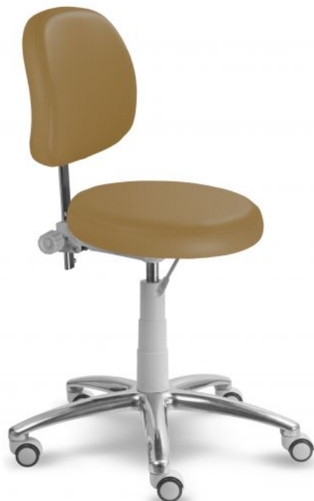
Ilustrační foto (mechanika):