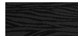
A10 mesh černá